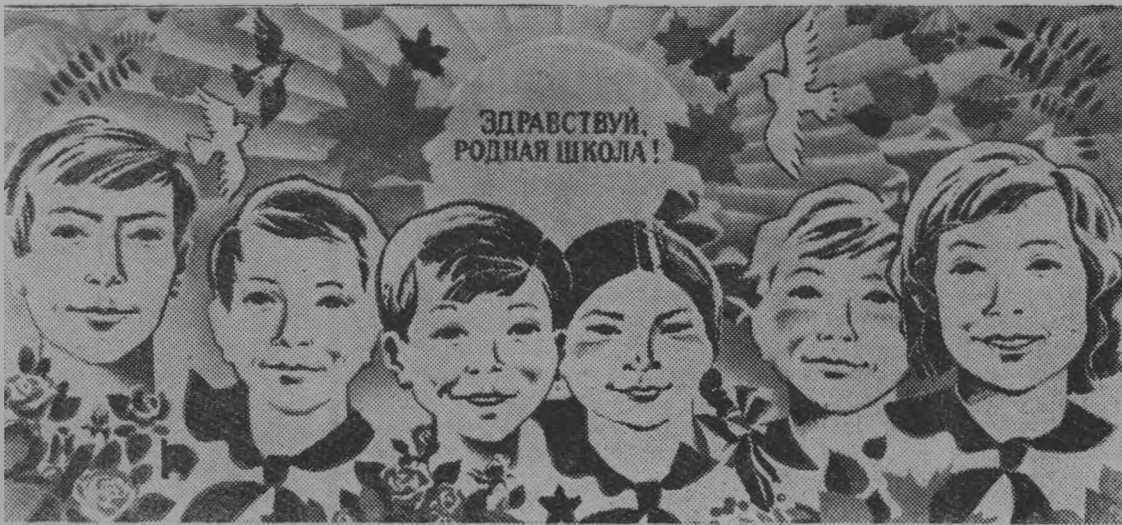
Плакат художника И. Овасапова. Издательство «Плакат». Фотохроника ТАСС.