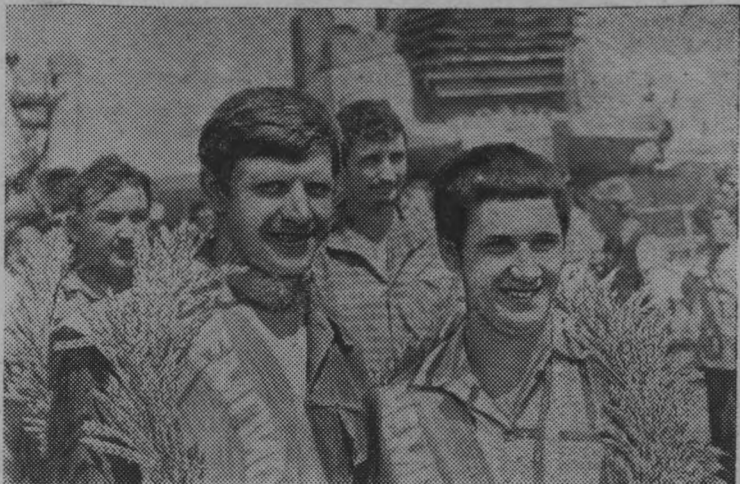
Краснодарский край. В колхозе имени Кирова Белореченского района с площади 1800 гектаров пшеница убрана за шесть дней. В среднем с каждого гектара получено по 36 центнеров зерна. В закрома Родины отправлено шесть ты-

«Коммунар» 93 «Путь Ленина» 91 Имени Кирова 91 «Красная нива» 88 «Малокаменский» 87 Имени Тимирязева 86 «Прогресс» 85 «Ошминский» 81 «Вякшенерский» 80 Имени Свердлова 76 Имени Ленина 76 «Колос» 63 Всего по району 84