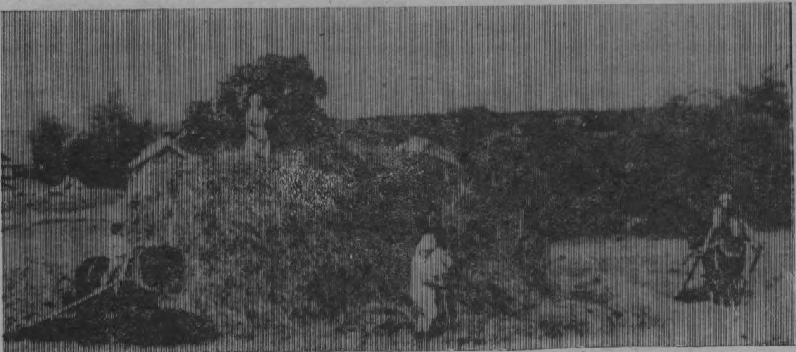
Заготовка сена в колхозе имени Кирова.

ЖДАНОВ. Роторные комплексы нового класса, выпуск которых освоено в объединении «Ждановтяжмаш», способны за час добыть и засыпать в вагоны эшелон угля. Завершено изготовление первого такого агрегата. Его производительность — пять миллионов тонн топлива в год, что равно мощности крупной шахты. Такие комплексы обеспечат наиболее эффективную разработку Экибастузского угольного бассейна в Казахстане.