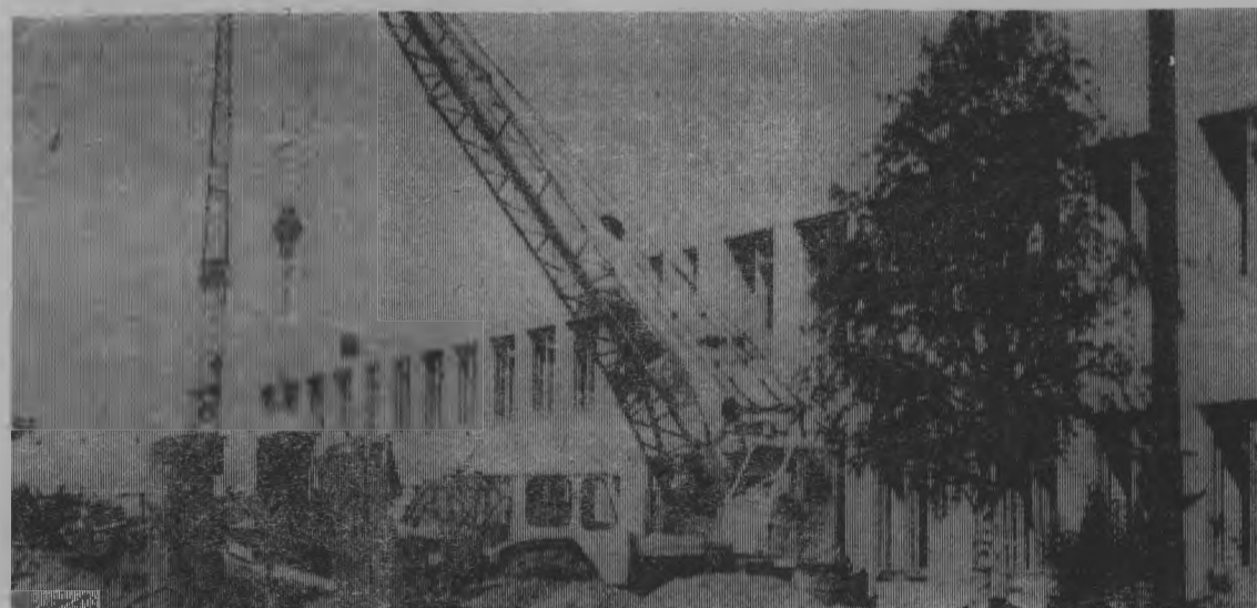
Общий вид пристроя к школе.

До начала нового учебного года остается менее полутора месяцев. Поэтому строители стараются использовать каждый час.