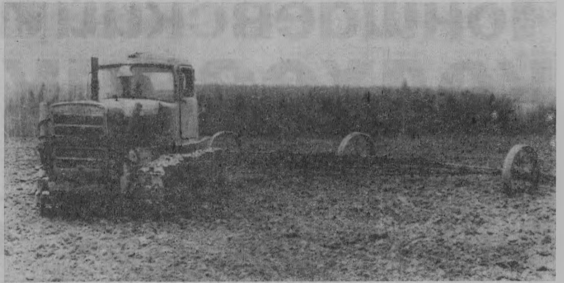
Подготовка почвы к севу.