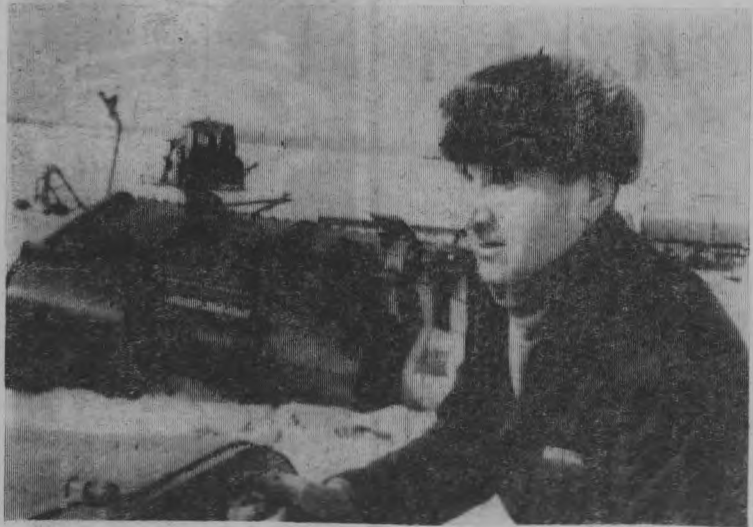
К. С. Репин.