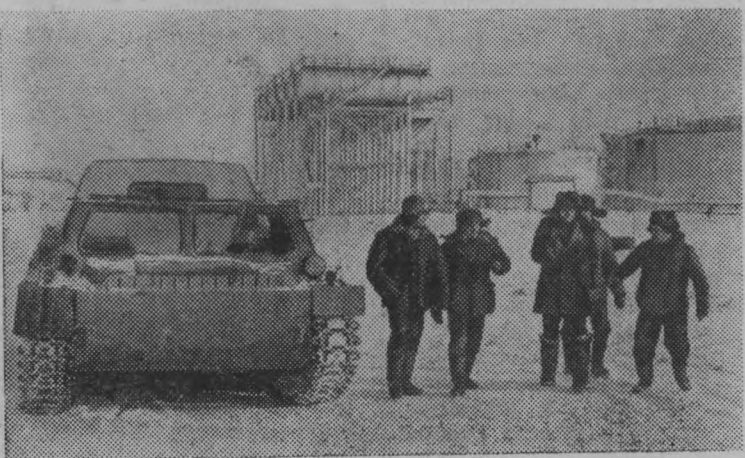
Тюменская область. Коллектив ордена Ленина Главтюменнефтегаза одержал новую трудовую победу. Впервые на северных месторождениях Западной Сибири добыто более 200 миллионов тонн нефти. Задание юбилейного года выполнено досрочно.