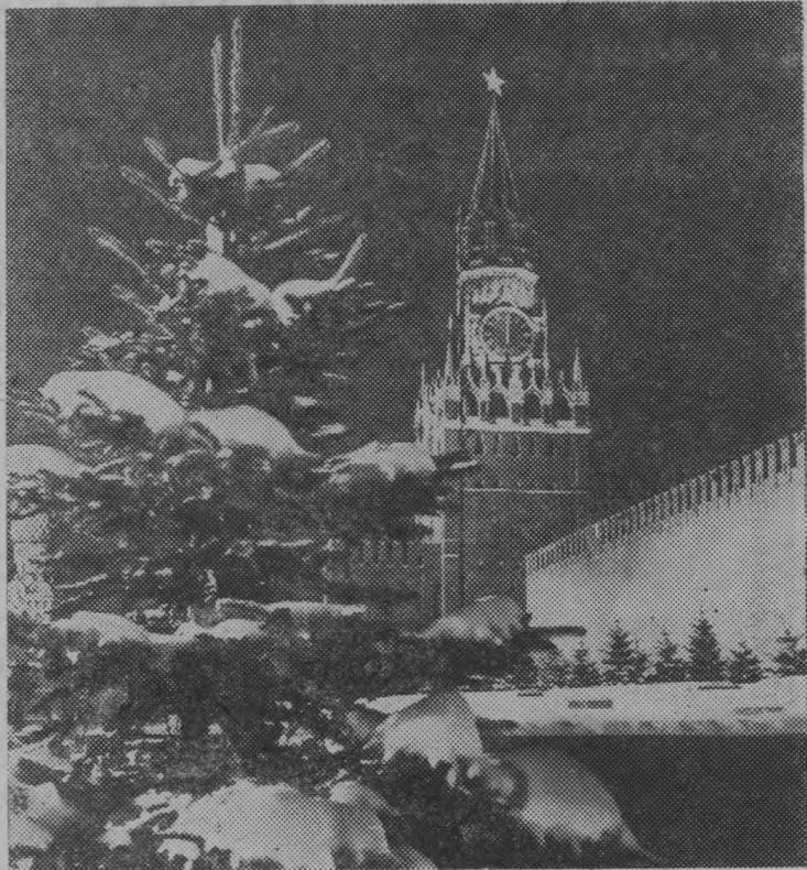
Москва. Спасская башня Кремля. (Фотохроника ТАСС).

«Государственный флаг Союза Советских Социалистических Республик, — говорится в статье 170 новой Конституции СССР, — представляет собой красное прямоугольное полотнище, с изображением в его верхнем углу, у древка, золотых серпа и молота и над ними красной пятиконечной звезды, — обремененной золотой каймой...»