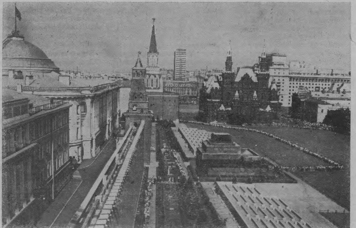
На снимке: Красная площадь.

тельства — вскоре взвился Государственный флаг РСФСР. Им стало Красное знамя, с которым российский пролетариат, возглавляемый партией коммунистов, вышел на борьбу с самодержавием и буржуазией и победил.