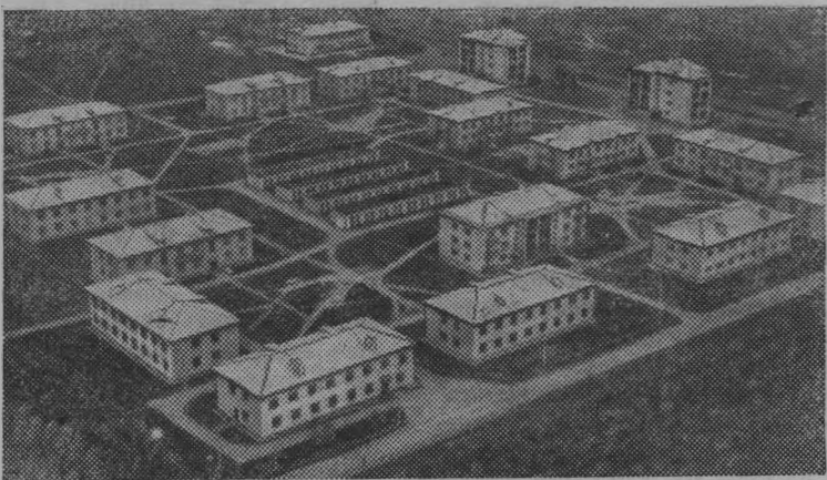
Новосибирская область. На берегу рукотворного Обского моря лежит старинное сибирское село Верх-Ирмень — усадьба колхоза «Большевик».