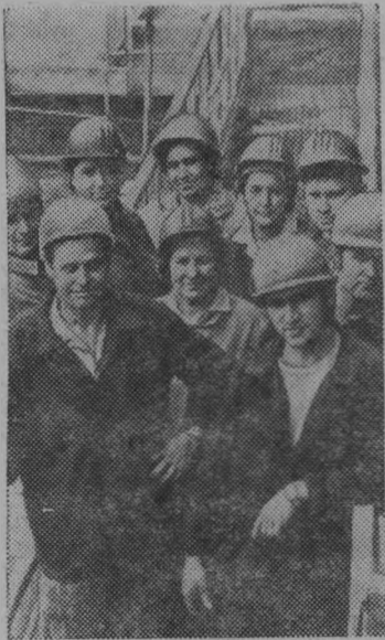
Воскресенск, Московская область. Подмосковский горнохимический завод выпускает

фосфоритную муку и кормовые обесфторенные фосфаты, которые используются в качестве минеральной добавки на комбикормовых заводах страны. Фосфатов выпускается 380 тысяч тонн в год.