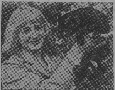
Курская область. Всеми цветами радуги играет 45-тысяч-

ное семейство норок в Полевском зверсовхозе. Голубые, пастельные, перламутровые шкурки ценных зверьков — главная продукция хозяйства. В нынешнем году здесь будет выращено «мягкого золота» на 1,9 миллиона рублей.