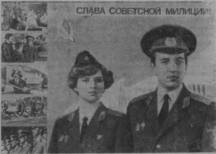
Плакат художника Н. Пшеницкого «Слава советской милиции!» Издательство «Плакат».