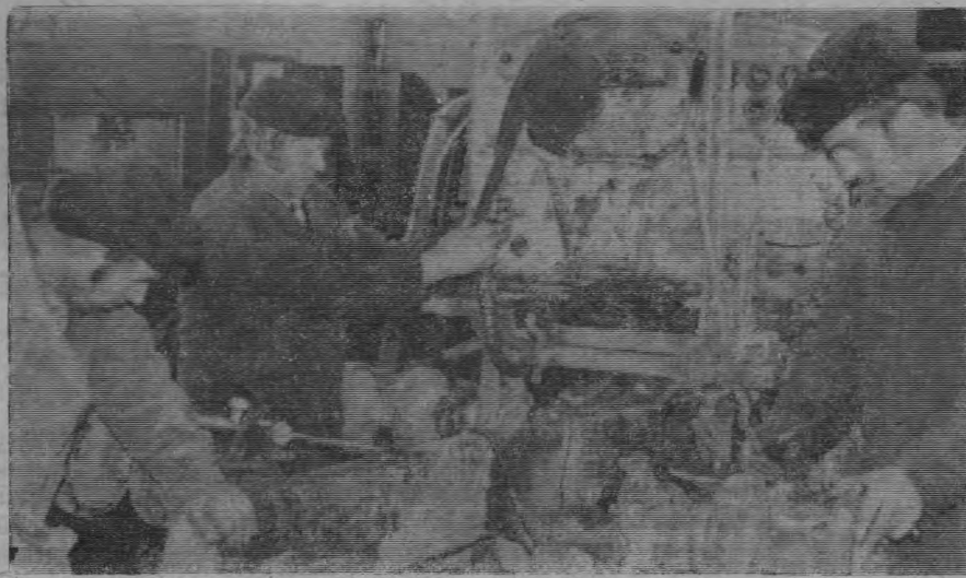
В ремонтно-механической мастерской Тонкинского районного объединения «Сельхозтехника» начался осенне-зимний ремонт машинно-тракторного парка. Как и прежде, первыми приступили к ремонту тракторов механизаторы колхоза «Память Ленина». На снимке: ремонт тракторов в мастерской р. о. «Сельхозтехника».