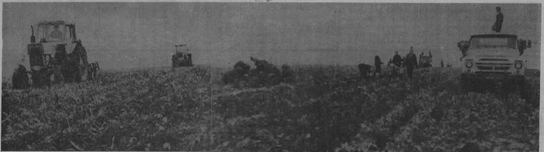
Уборка картофеля в колхозе «Путь Ленина».