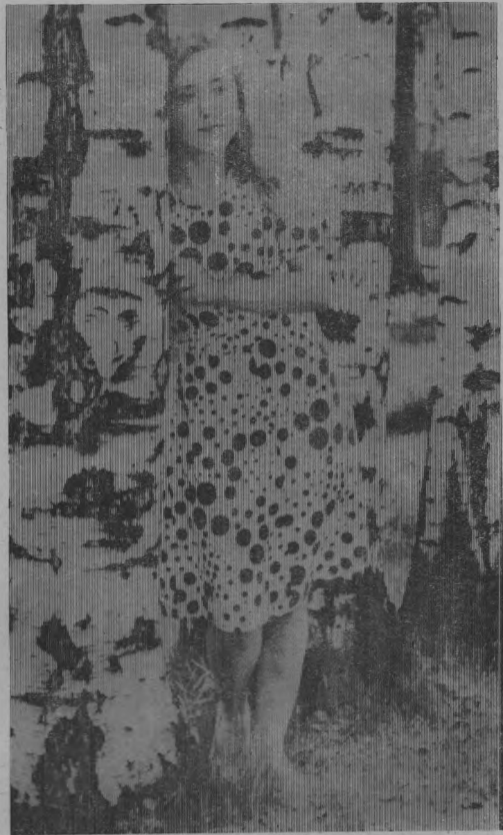
Береза белая, подруга... (Раздумье).

А потом всех учащихся и гостей осеннего бала ведущие