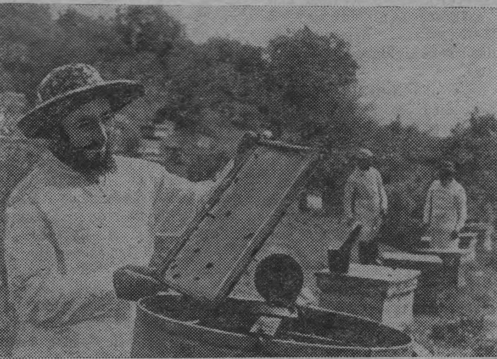
Пчеловоды лесных хозяйств имени Кирова и «Кара-Алма» — главные поставщики лечебного нектара Южной Киргизии ведут качку горного меда. На их пасеках сейчас насчитывается шесть тысяч пчелиных семей.