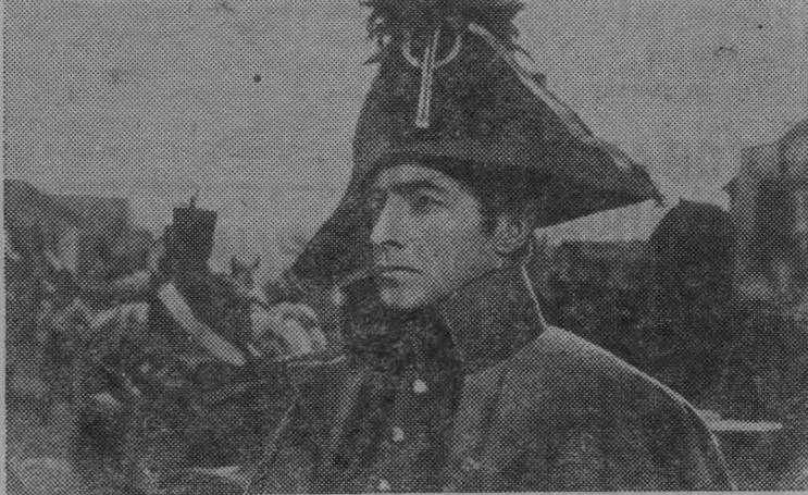
На снимках: слева — Л. Н. Толстой и А. М. Горький в Ясной Поляне (1901 г.). На снимке: в роли князя Андрея Болконского — артист Вячеслав Тихонов.

Кадр из фильма «Война и мир».