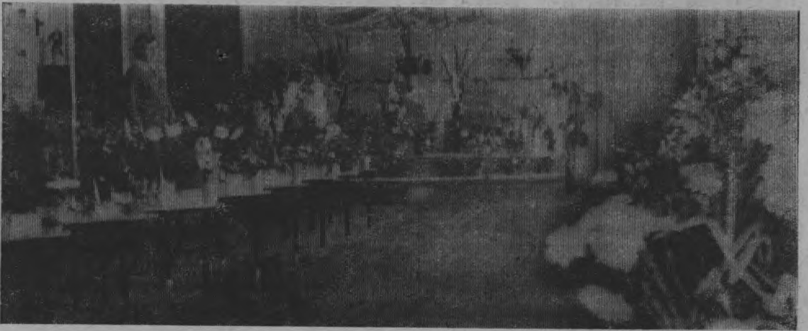
Царство цветов. (Выставка цветов в районном Доме культуры.)