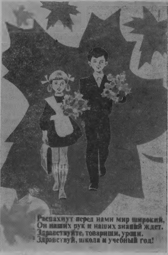
Распахнут перед нами мир широкий. Он наших рук и наших знаний ждёт. Здравствуй, товарищи, урочище! Здравствуй, школа и учебный год!

Летние школьные каникулы позади. Много было за это время походов по родным местам, туристических поездок в различные города нашей страны. А сколько было проведено интересных игр, прочитано новых книжек, просмотрено новых фильмов.