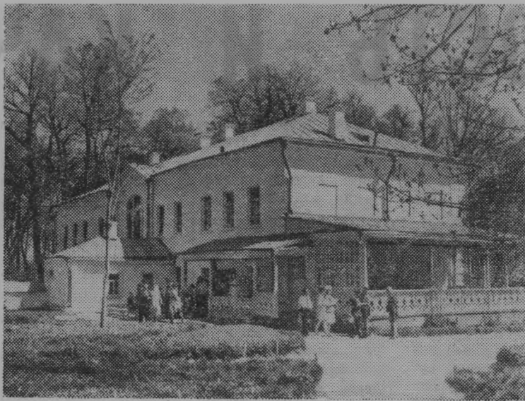
На снимке: Дом-музей Л. Н. Толстого в Ясной Поляне.