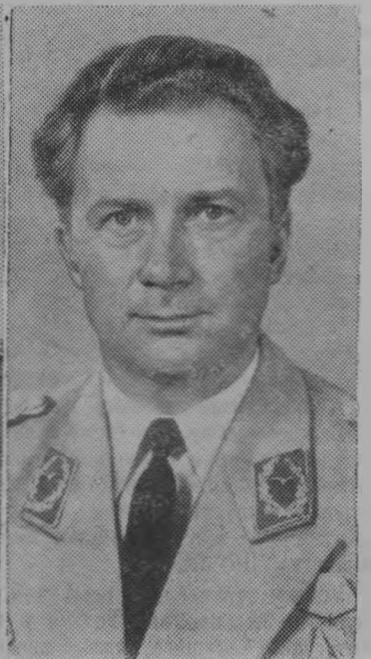
Командир международного экипажа космического корабля «Союз-31» летчик-космонавт СССР дважды Герой Советского Союза подполковник В. Ф. Быковский.