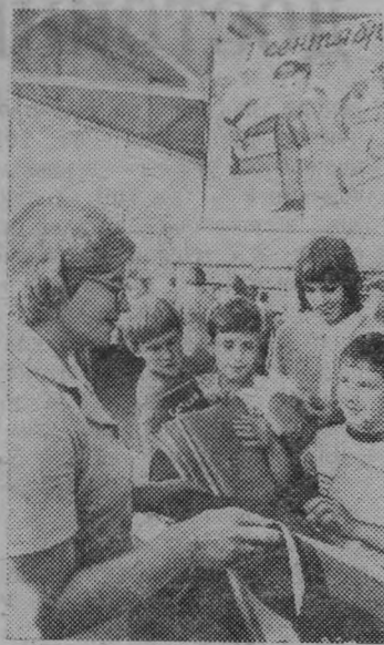
Ленинград. В выставочном комплексе на Васильевском острове открылся общегород-

В. МЕНЬКОВ, госавтоинспектор Тоншаевского РОВД.