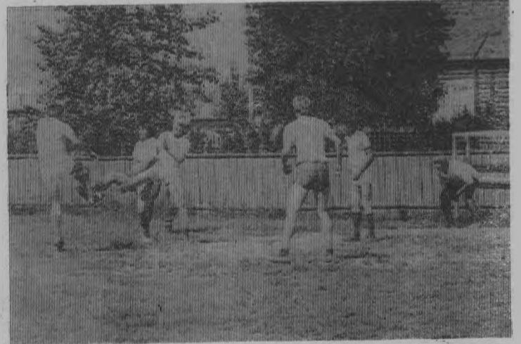
Все готовы к приему мяча. Кто завладеет им: тоншаевцы или шайгинцы?