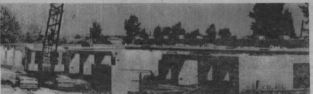
Строится Пижемская участковая больница на 250 мест