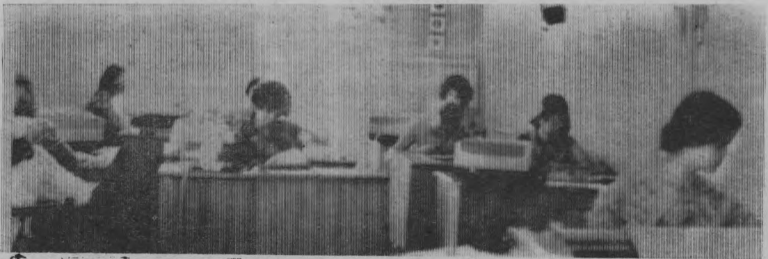
В цехе операторов машино-счетной станции.