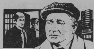
ДЛИННОЕ ДЛИННОЕ ДЕЛО

По роду своей профессии Лужин сталкивается с большим количеством людей, дальнейшая жизнь которых во многом зависит от его нравственных позиций. «Если эта работа и на год, — говорит он об одном затянувшемся деле, — но это все-таки лучше, чем осудить невиновного на пятнадцать лет».