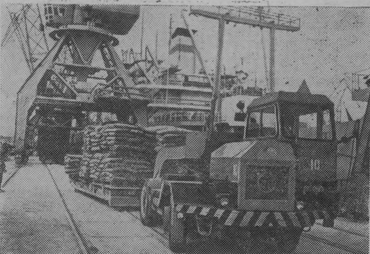
Эстонская ССР. В Таллинском морском торговом порту.