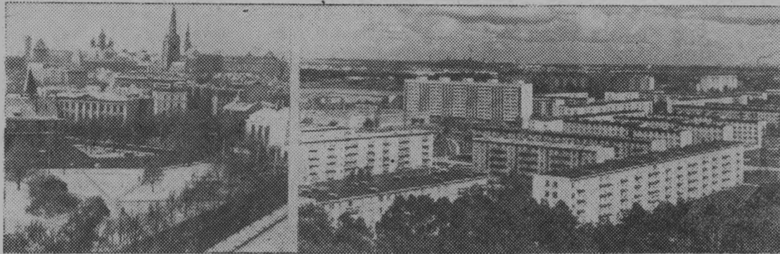
Столица Эстонской ССР — город Таллин. Справа — новый жилой район — Мустамяэ.

Крепки и монолитны братская дружба и единство всех наций и народностей, составляющих великий и могучий Союз Советских Социалистических Республик. Его образование и успешное развитие являются триумфом ленинской национальной политики КПСС... (Из Постановления ЦК КПСС «О 60-й годовщине Великой Октябрьской социалистической революции»).