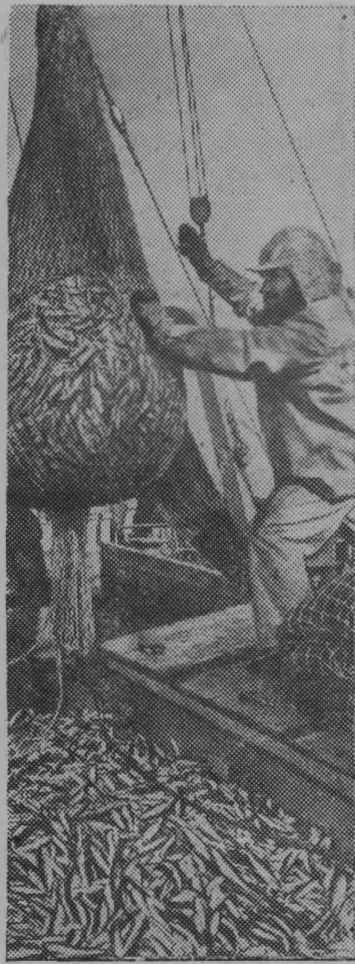
Эстонская ССР. Хорош улов у рыбаков колхоза «Хийу калур».

Мелиораторы Эстонии досрочно выполнили задания первого квартала второго года пятилетки.