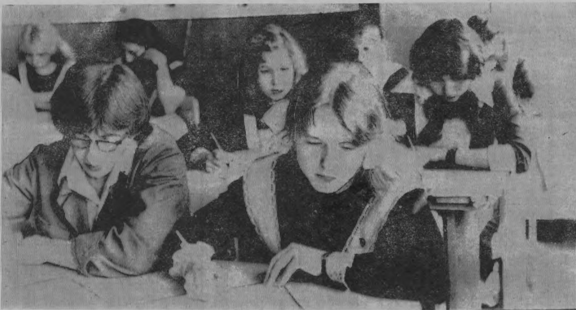
Выпускники Пижемской средней школы пишут сочинение.

...Склонились десятиклассники над чистыми пока еще листами. Какую тему предпочесть? Кто-то решил быстрее — и уже заскользило перо по бумаге. Через несколько минут все писали — шел экзамен на аттестат зрелости. Главный в их жизни экзамен. А сколько их еще впереди?... А. МИХАЛИЦЫН.