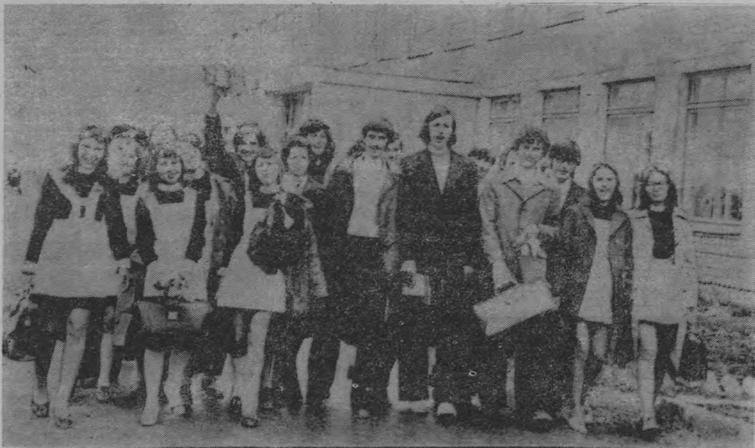
Последний звонок — радостное событие в жизни выпускников Тоншаевской средней школы.