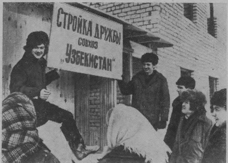
Фото И. Дынина.