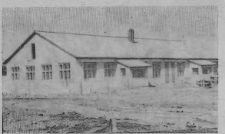
Заканчивается строительство детского комбината на центральной усадьбе совхоза «Вякшенерский». Скоро в нем поселятся дети рабочих совхоза.