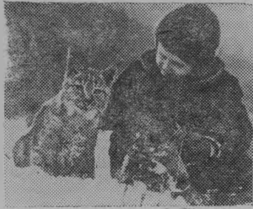
Львовская область. Этого рыска подобрала егери госу-

дарственного охотхозяйства «Майдан» в Сколевском районе. Назвали Маричкой, выкормили из соски. Живет рысенок в одной клетке с котенком, откликается на имя, радуется теплу человеческих рук.