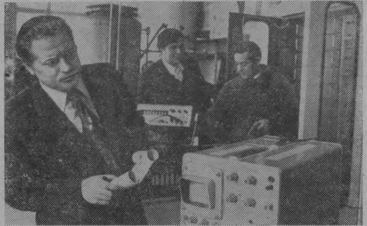
Москва. Всесоюзный научно-исследовательский институт электрификации сельского хозяйства в 10-й пятилетке наметил обеспечить внедрение в сельскохозяйственное производство научных разработок с экономическим эффектом в 80 миллионов рублей.

Главным предприятием, занимающимся бытовым обслуживанием населения района, является комбинат бытового обслуживания. В целом по району план двух месяцев им выполнен на 96 процентов. Реализовано бытовых услуг населению по району на 37,6 тысячи рублей, что на 3,7 тысячи рублей больше, чем за этот же период в прошлом году. Отдельные виды услуг в разрезе по мастерским не были выполнены в течение двух истекших месяцев.