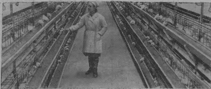
Московская область. Работники Петелинской птицефабрики уже в сентябре рапортовали о завершении плана двух лет пятилетки. Государству было продано 12280 тонн мяса. Производительность труда на фабрике возросла на 15 процентов.

Коллектив предприятия имеет один из самых высоких в стране показателей по производству мяса с одного квадратного метра площади. Петелинцы к концу года решили получить по 138—140 килограммов мяса с одного квадратного метра, что на 10—12 килограммов превзойдет прошлогодние результаты.