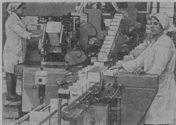
Передовой — опыт в действии