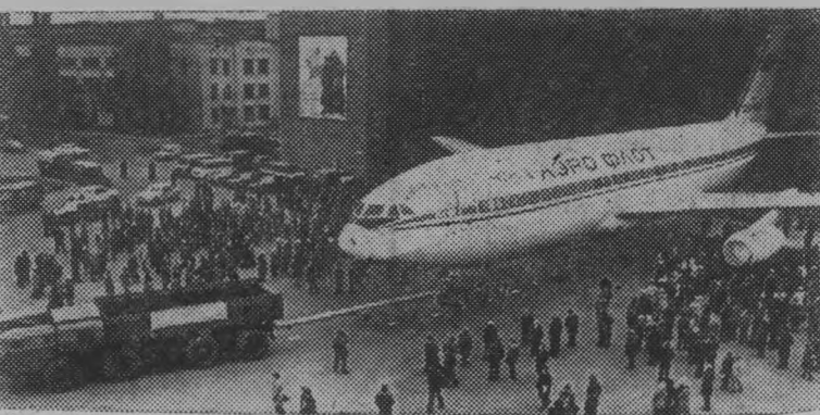
На Воронежском авиационном заводе досрочно выпущен первый серийный самолет «ИЛ-86» (аэробус). Самолетостроители выполнили социалистические обязательства, взятые в честь 60-летия Великого Октября.

Новая машина сможет взять на борт 350 пассажиров. Его скорость 900—950 километров в час, высота полета 9—10 тысяч метров.