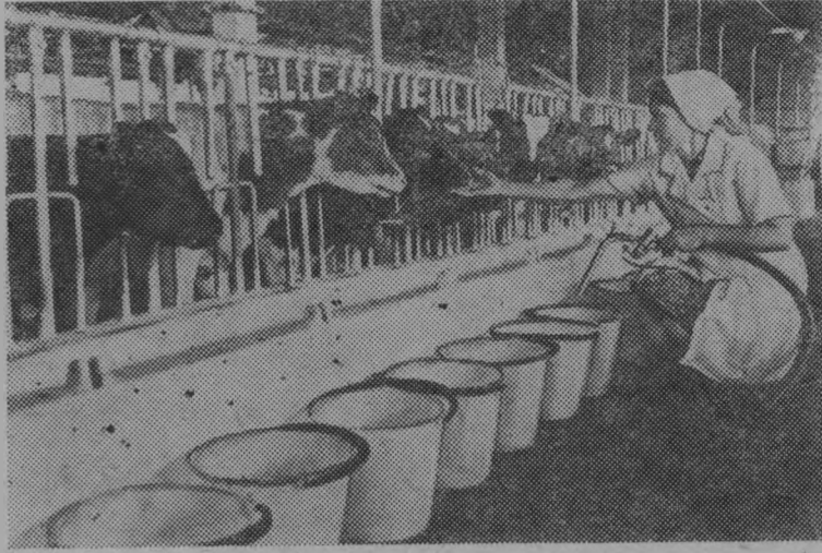
Челябинская область. В совхозе «Дубровский» в этом году вошел в строй комплекс по выращиванию и откорму крупного рогатого скота. 15 цехов рассчитаны на содержание десяти тысяч бычков. Проектная мощность комплекса—4300 тонн мяса в год.

Технология интенсивного промышленного откорма позволит затрачивать всего 6 кормовых единиц на единицу привеса. Все процессы ухода за молодняком механизированы и автоматизированы, приготовление и раздача кормов ведется с единого пульта. На комплексе телята поступают в 15-дневном возрасте. За 13 месяцев они набирают вес до 430 килограммов.