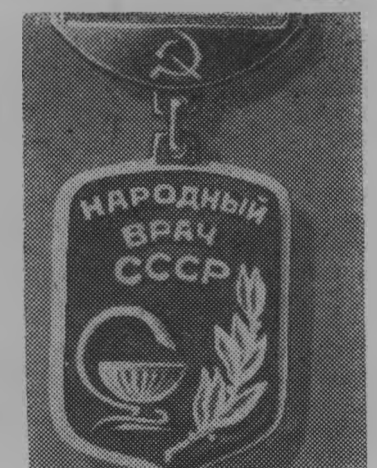
Нагрудный знак «Народный врач СССР».

Тем временем конструкторы работают над очередной постройкой — МТЗ-142 мощностью 150 лошадиных сил. Три опытных образца уже вышли на ведомственные испытания.