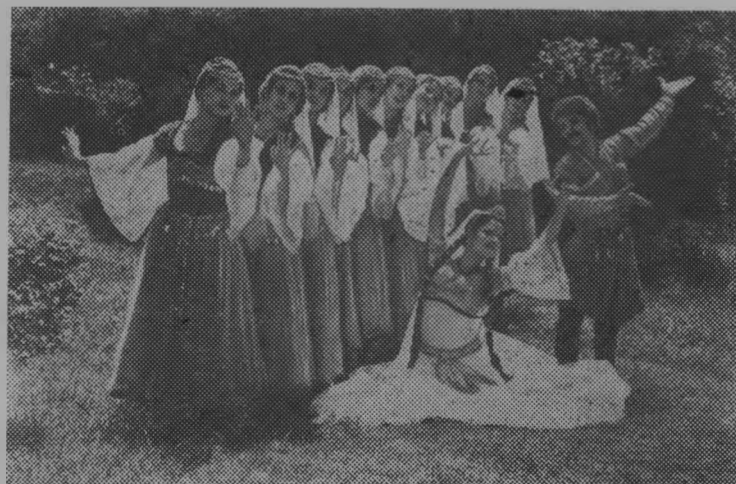
Азербайджанская ССР. Государственный ансамбль танца Азербайджана известен далеко за пределами республики. Он часто выезжает на гастроли по Советскому Союзу и за рубеж.