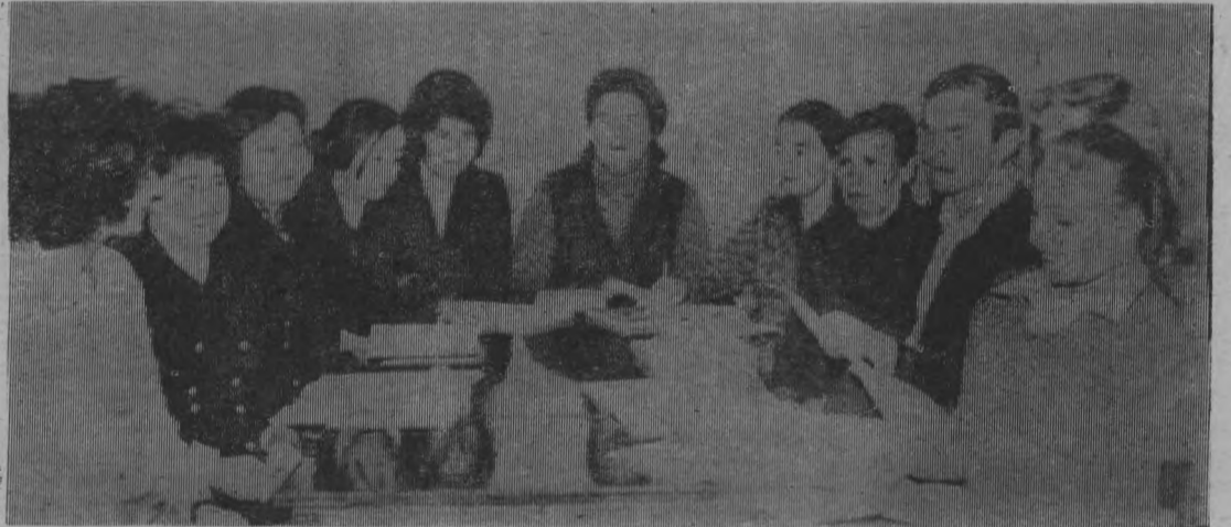
На снимке: идет очередной педсовет в Кодочиговской восьмилетней школе.

Кроме материала по учебнику, я даю ребятам и практическое занятие. В нашей школе неплохая коллекция бабочек и жуков, которых собрали сами ребята. Все экспонаты снабжены надписями. Кроме пужных знаний, у ребят появляется интерес к окружающей природе. Чем лучше знаешь окружающий мир, законы его развития, тем больше внимания обращаешь охране природы. Да и где, если не на уроках ботаники, зоологии, биологии и химии, прививать ребятам любовь к родной природе? Ребята наши — не пассивные созерцатели того, что делается вокруг. Они принимают активное участие в озеленении поселка, охотно