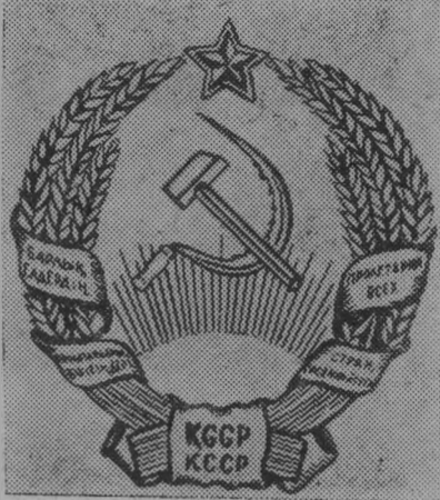
Герб Казахской ССР.

Казахская Советская Социалистическая Республика