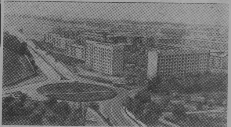
Столица Казахской ССР — Алма-Ата. Новый микрорайон «Орбита».