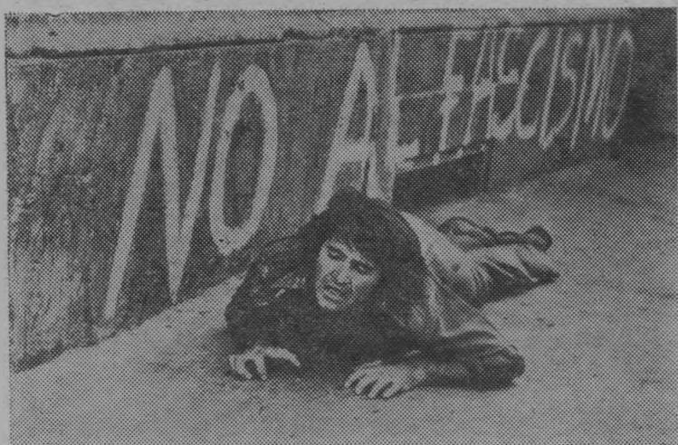
Москва. На студии «Мосфильм» завершена работа над художественным фильмом «Ночь над Чили». Лента рассказывает о трагических сентябрьских событиях 1973 года в Чили.