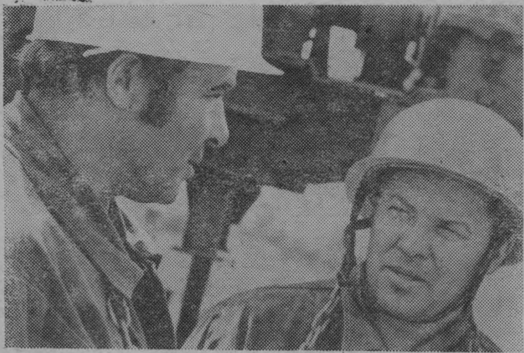
Москва. На южной окраине столицы все выше поднимаются этажи экспериментального жилого района Чертаново-Северное. Эта стройка, где сооружается уникальный комплекс жилых и общественных

зданий, стала своеобразным полигоном для испытания новинок строительной техники и технологии. На третьем участке СУ-31 Московского государственного проектно-строительного объ-