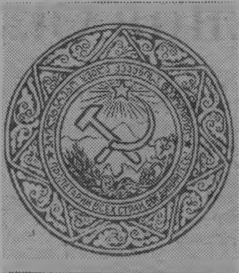
Герб Грузинской ССР.

Грузинская Советская Социалистическая Республика