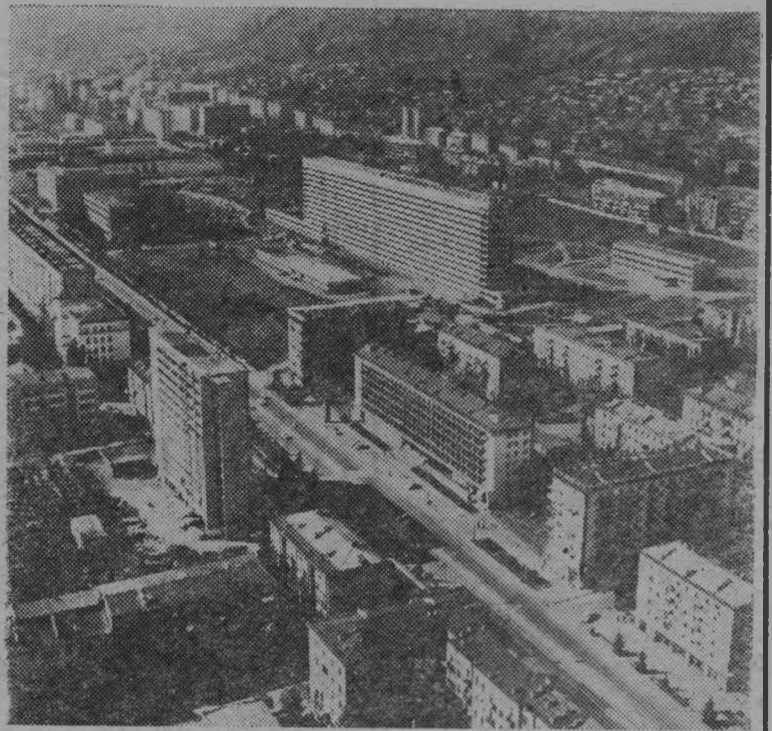
Столица Грузинской ССР Тбилиси. Новый архитектурный комплекс на проспекте Важа Пшавела в Орджоникидзевском районе.

История становления и развития народного хозяйства и культуры республики — убедительный пример силы и жизненной ленинской национальной политики, братской дружбы советских народов, о политических, экономических и социальных основах которой так емко сказано в проекте новой Конституции СССР.