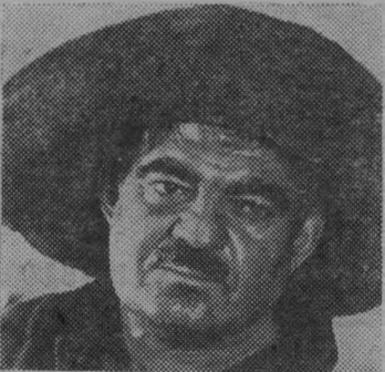
Соревнуясь за достойную встречу 60-летия Великого Октября, успешно несет трудовую вахту коллектив Руставского металлургического завода. С начала года на его счету десятки тысяч тонн сверхплановой стали, чугуна, проката.