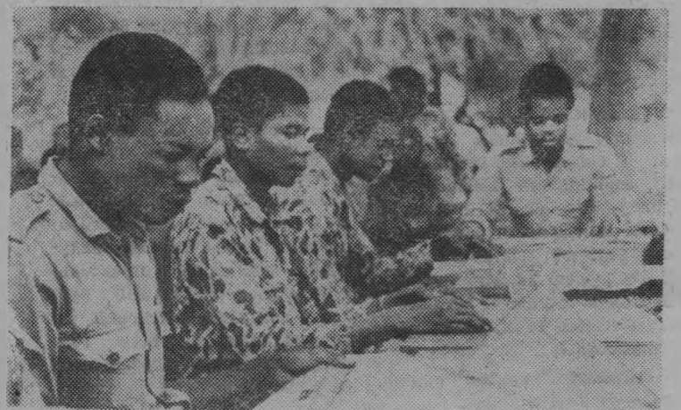
В Народной Республике Ангола создано первое военно-политическое училище. Среди его слушателей — активисты МПЛА и бойцы вооруженных сил страны, отличившиеся в боях против португальских колонизаторов и мятежных банд.

На снимке: курсанты училища на занятиях.