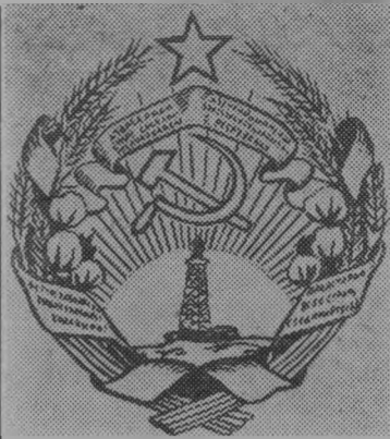
Герб Азербайджанской ССР.

«Советский Азербайджан, превратившийся из бывшей колониальной окраины Российской империи в одну из цветущих республик нашей страны, строящей коммунизм, — это убедительное доказательство могучей творческой силы социализма...».