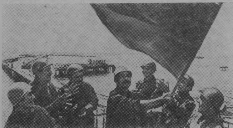
Азербайджанская ССР. Коллективу цеха капитального ремонта скважин ИГДУ имени XXII съезда КПСС «Нефтяные Камни» по итогам социалистического соревнования вручено переходящее Красное знамя управления.

При помощи народов-братьев трудящиеся республики ныне осваивают нефтяные месторождения Каспия. Впервые в отечественной практике стальной остров построен в Каспийском море, где глубина достигает 84 метров.