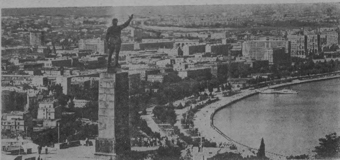
Баку — столица Азербайджанской ССР. Вид на город с парка им. С. М. Кирова.

Бакинские кондиционеры отгружаются во все союзные республики, покупают их в ряде зарубежных государств. Высокие эксплуатационные качества, долговечность и надежность в работе, отличают эти агрегаты.