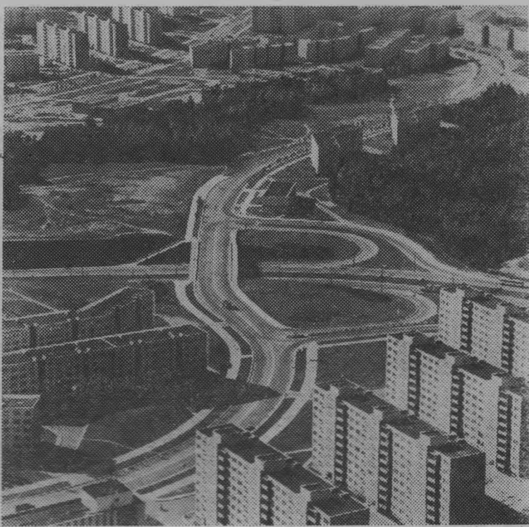
Столица Литовской ССР — Вильнюс. Новые жилые кварталы в районе Лаздинай.

В объединение входит почти две тысячи пайщиков — около двух третей всех колхозов, совхозов и других сельскохозяйственных организаций республики. На строительство санаториев и домов отдыха на курортах Балтийского моря — в Паланге, Ниде, Швентойи, в других живописных уголках республики за последние годы израсходованы десятки миллионов рублей.