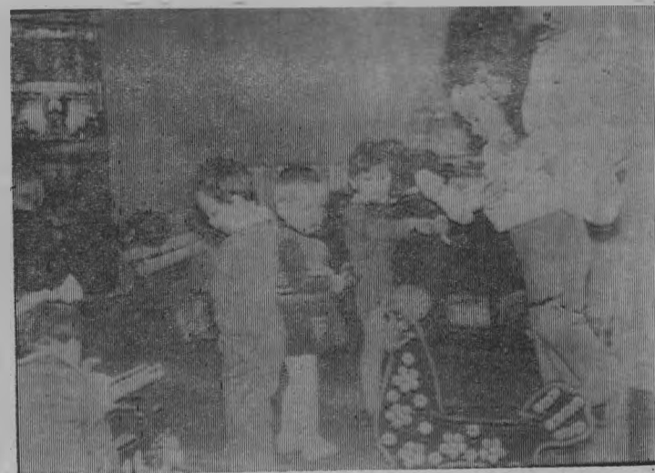
В игровой комнате.

По проекту комбинат рассчитан на 6 возрастных групп, две из них будут ясельные, а остальные четыре — для детей постарше. Для каждой возрастной группы отведены комнаты для игр и за-