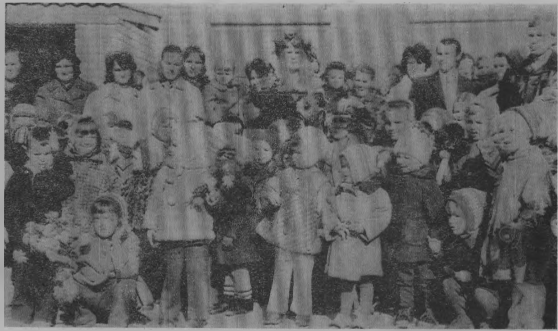
Маленькие новоселы с родителями.