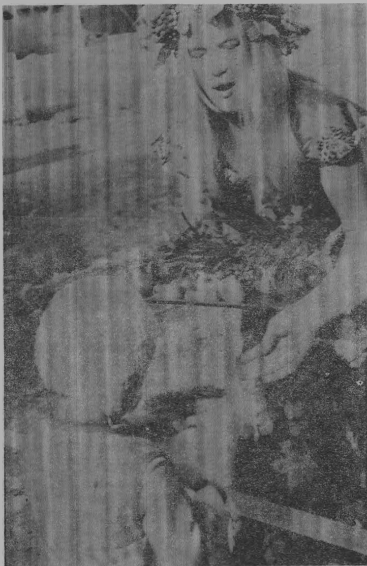
Щедрыми дарами встречает «осень» детей.