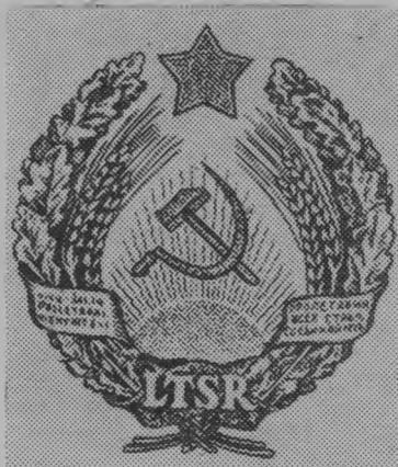
Герб Литовской ССР.