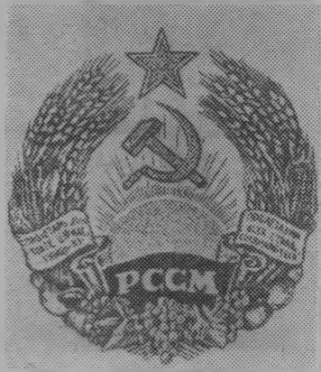
Герб Молдавской ССР.