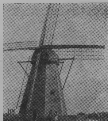
«Ожила» ветряная мельница в селе Сергово под Новгородом. После ремонта и реконструкции здесь разместились музей истории передового в области колхоза «Искра». В трех залах собрано более 300 экспонатов.

На снимке: мельница-музей.