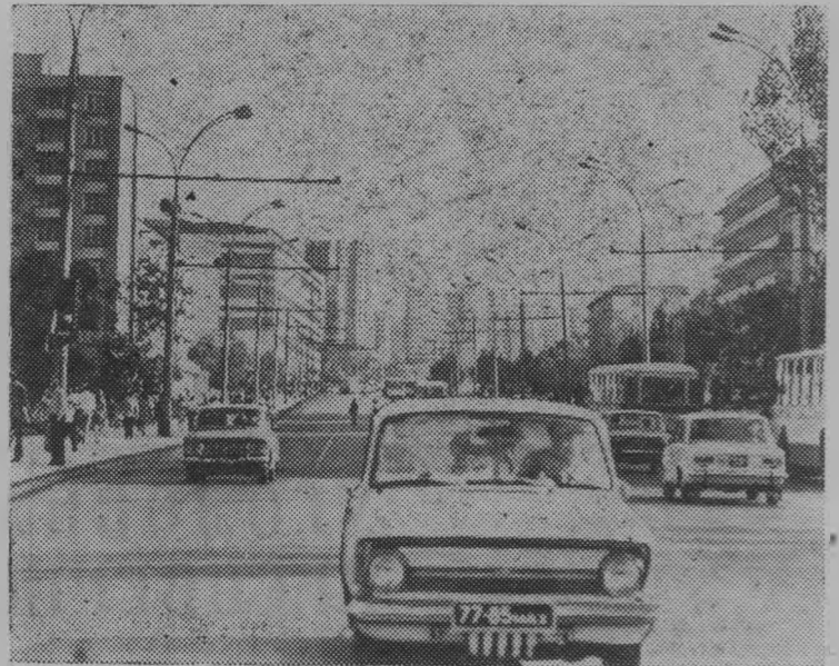
Столица Молдавской ССР — Кишинев. На снимке: улица Тимошенко, связывающая старую часть города с новыми микрорайонами.

слесарь завода «Электроточприбор», заместитель Председателя Президиума Верховного Совета Молдавской ССР, Герой Социалистического Труда.