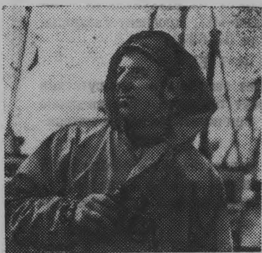
Латвийская ССР. Рыболовецкий совхоз «Узвара» («Победа»), расположенный в устье реки Лиелупе — один из передовых в Латвии.

В животноводстве поголовье крупнорогатого скота будет доведено до 1100 голов к 1980 году, из них 500 голов дойного стада. Для обеспечения данного поголовья помещениями будем реконструировать коровник на 200 голов и построим телятник для откормочного поголовья. Дойное стадо у нас будет сконцентрировано на двух фермах в Больших Селках и Ромачах. Кормовую базу будем укреплять за счет повышения урожайности и дальнейшего окультуривания лугов и пастбищ.