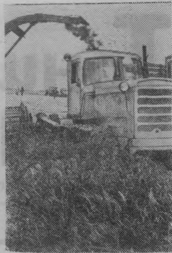
На лугах Рязанщины в разгаре зеленая жатва. Передовые хозяйства области борются за создание полуторогодовалого запаса кормов. Высокими темпами ведут заготовки труженики совхоза «Новоселки». В этом году здесь будет заготовлено 2.500 тонн сенажа, 2.000 тонн сена, 6.000 тонн силоса. Производительность специального кормозаготовительного отряда, созданного в хозяйстве, более двухсот тонн зеленой массы за смену.

ответственный секретарь правления общества «Знание».