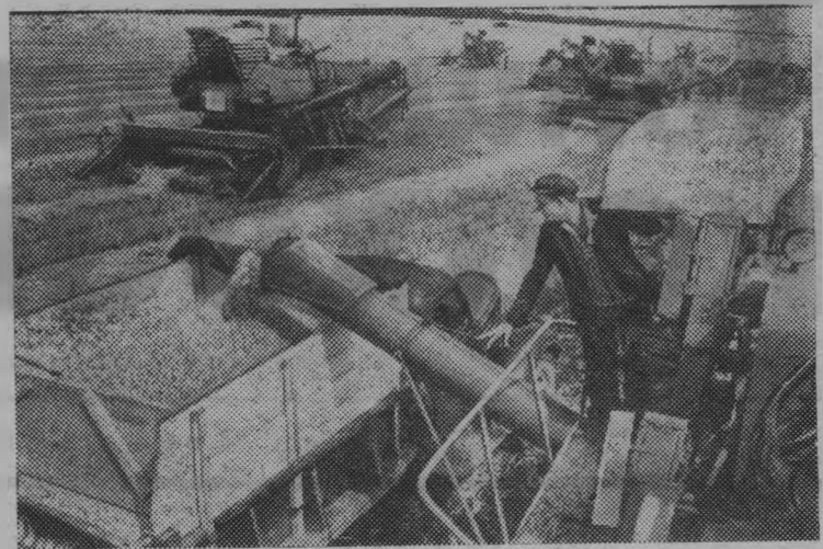
Краснодарский край. В колхозе «Красная звезда» Динского района в нынешнюю страду работают уборочные механизированные комплексы. Озимые предстоит убрать с площади более 5700 гектаров. Колхоз продает нынче государству 13.000 тонн зерна. На снимке: выгрузка зерна из бункера.

этом году значительно обновился комбайновый парк. Новые комбайны СК-5 будут работать на полях совхозов «Ошминский», «Вякшенерский», колхозов «Путь Ленина» «Красная нива», имени Тимирязева.