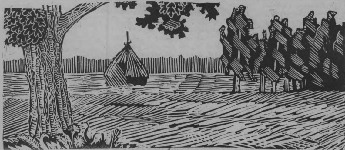
На лугах поднимаются стога