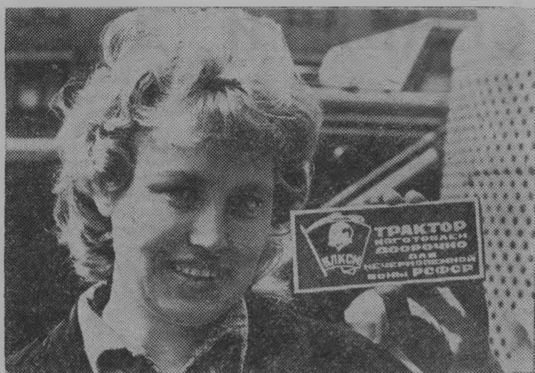
Комсомольская организация Челябинского тракторостроительного объединения провела субботник, на котором молодежь предприятия собрала 42 трактора для Нечерноземной зоны РСФСР.

ный. Строительством занимаются рабочие Тоншаевской МПМК и Альцевского стройучастка. Последние строят зерносклад. Сметная стоимость этого объекта 169 тысяч рублей. Из этой суммы освоено пока меньше половины. Намечено сдать его в эксплуатацию в четвертом квартале. Это, конечно, поздовато. Уже стропильная система начата. Но впереди дел еще непочатый край: установка оборудования, строительство закровов, столярные работы и многое другое. Главное сейчас заключается в том, чтобы и овощехранилище, и зерносклад были сданы в срок. Эти объекты данным хозяйствам очень нужны. Т. ТОМАРОВА.