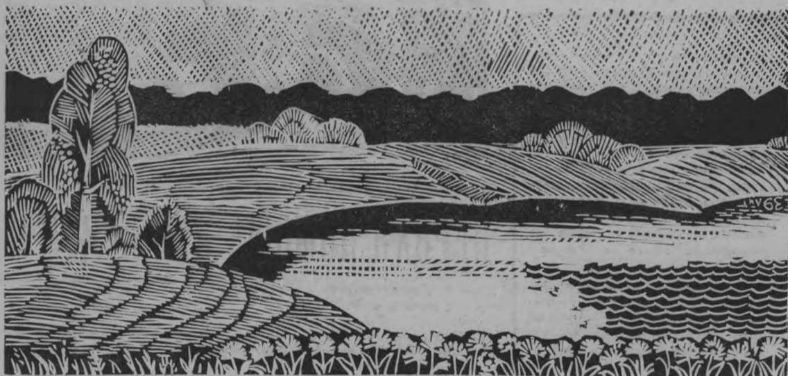
У речной заводи