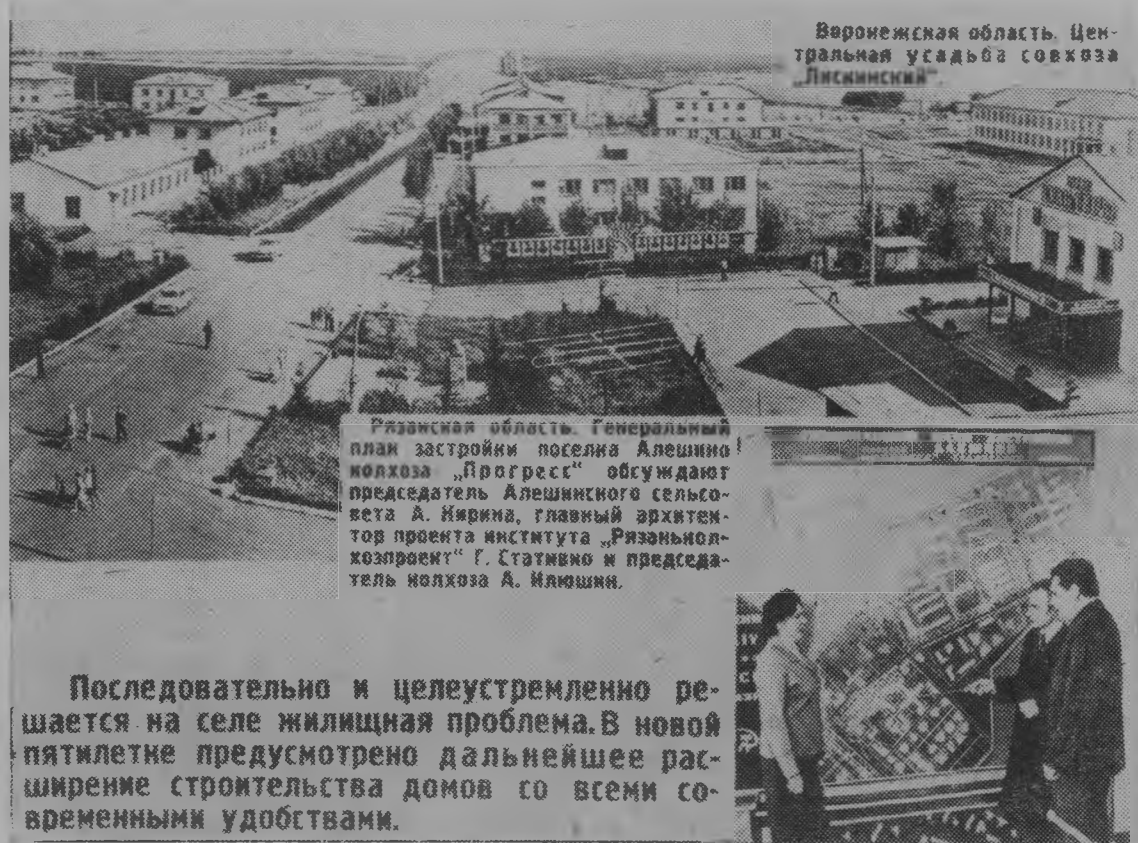
Воронежская область. Центральная усадьба совхоза «Лисинский»