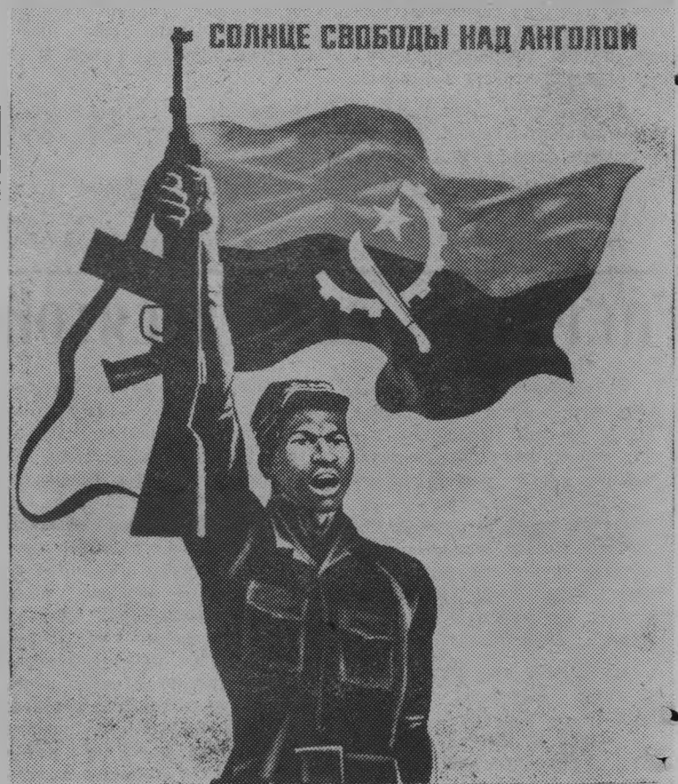
Плакат художника А. Кинбургского. Издательство «Плакат». (Фотохроника ТАСС).