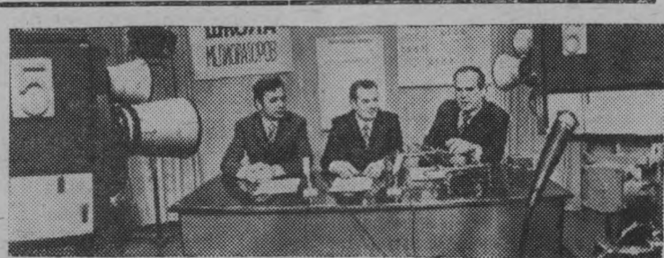
При Саратовском областном телевидении работает школа мелиораторов.

Для заготовки 15 тысяч тонн сенажа и 30 тысяч тонн силоса достаточно многолетних, однолетних трав, силосных культур. Район располагает большим количеством силосоуборочной техники: всего семьдесят машин. Если в работе будет только пятьдесят машин, то ежедневно можно свободно закладывать по 2500-3000 тонн силоса.